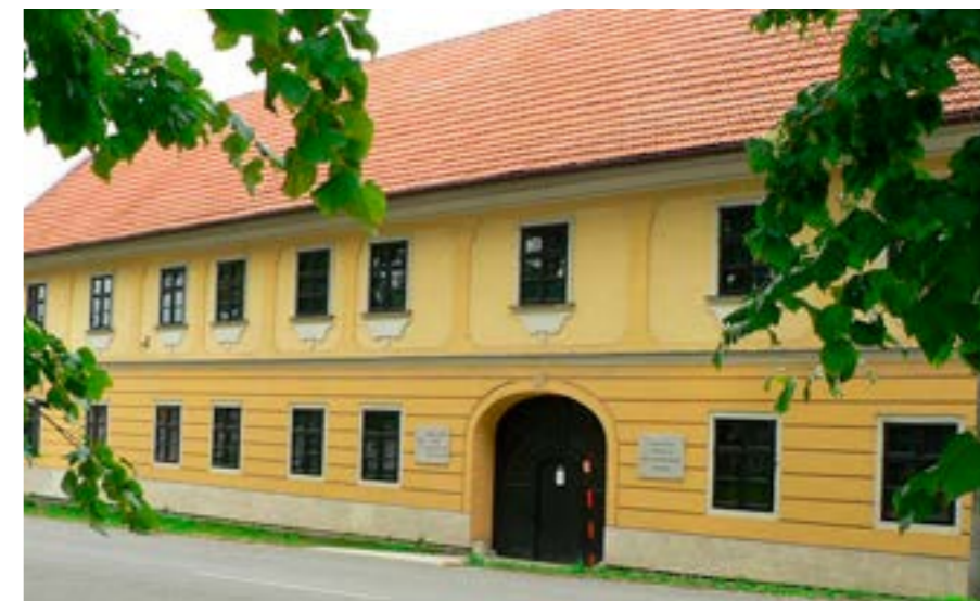
Budova Gymnázia v Kláštore pod Znievom