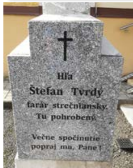
Hrob Štefana Tvrdeho pred kostolom v Strečne